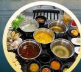
ชาบูฮ่องกง

02-04 มิ.ย. 18-20 มิ.ย. 07-09 มิ.ย. 20-22 มิ.ย. 13-15 มิ.ย. 25-27 มิ.ย. 14-16 มิ.ย. 28-30 มิ.ย.