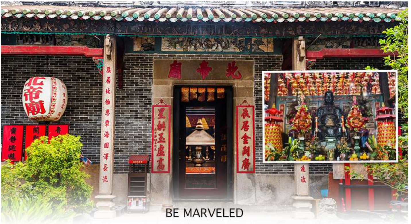
BE MARVELED วัดปักไต่

จากนั้นนำท่านขอปิ้ง ย่านมงก๊อก (MONG KOK) เป็นแหล่งช้อปปิ้งที่เต็มไปด้วยตรอกซอกซอยที่มี เอกลักษณ์แปลกตา รวมทั้งตลาดเก่าแก่ที่สะท้อนเสน่ห์และวิถีชีวิตของคนท้องถิ่น ถือเป็นหนึ่งในย่านยอดนิยมที่นักท่องเที่ยวทุกคนต้องแวะเวียนมา มีร้านสวยๆ บาร์เท่ๆ หลบซ่อนตัวอยู่มากมาย ภายในย่านมีตลาดนัด LADIES' MARKET ขนาดใหญ่ซึ่งมีร้านขายเสื้อผ้า เครื่องสำอาง รองเท้า กระเป๋า เครื่องประดับมากมาย อีกทั้งยังมีร้านอาหาร และเครื่องดื่ม ที่ขึ้นชื่อหลากหลายชนิด ให้ทุกท่าน ได้ลองลิ้มรสอีกมากมาย