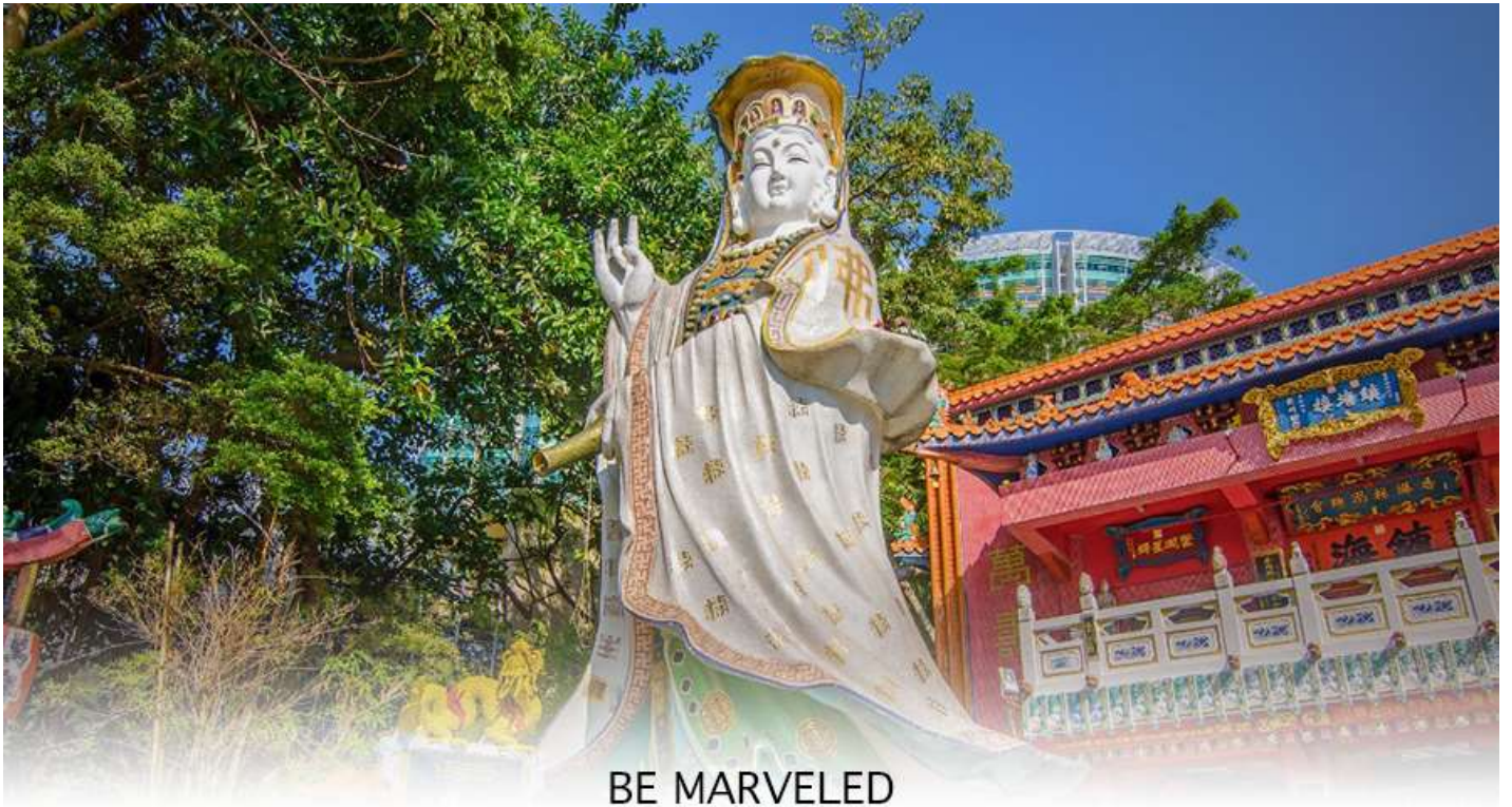
BE MARVELED วัดเจ้าแม่กวนอิมริพลส์เบย์