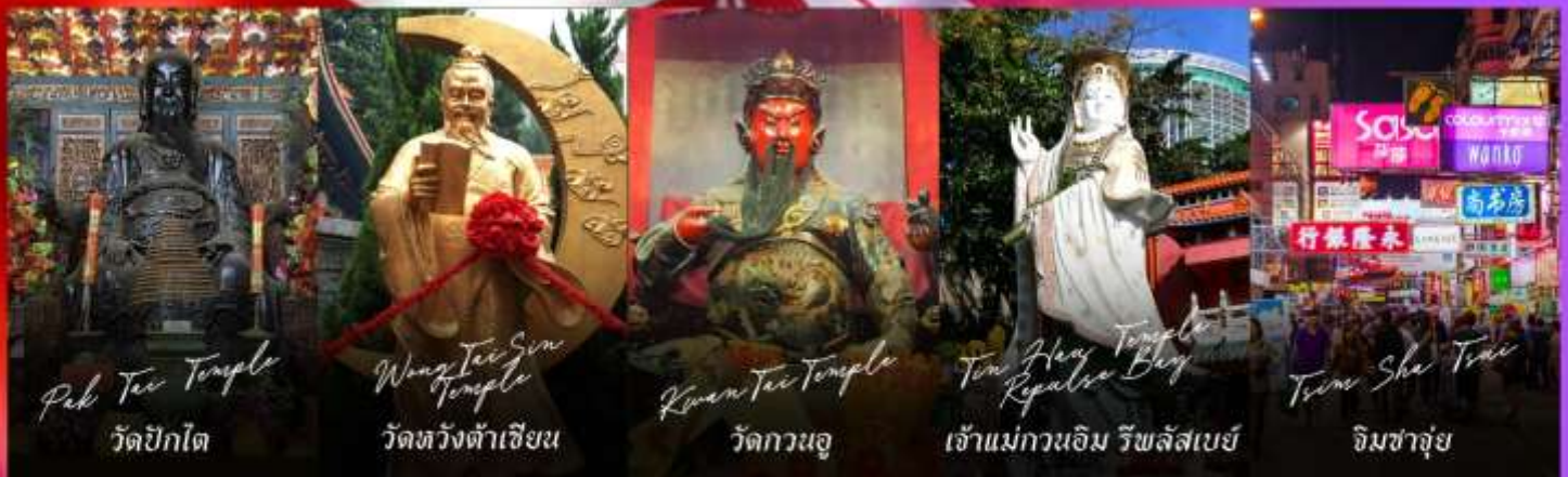
Pak Tai Temple วัดปึกไต้

รายการทัวร์ข้างต้นอาจมีการปรับเปลี่ยนเพื่อความเหมาะสม