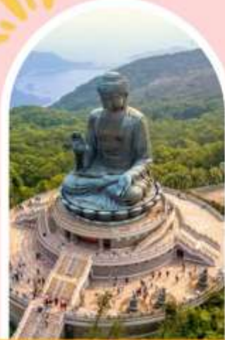
นั่งกระเชานองปิง