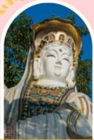
ริพลัสเบย์