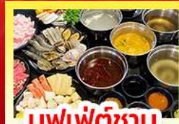
บุฟเฟ่ต์ซาบู