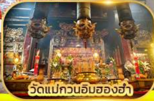
วัดแม่กวนอิมฮ่องกง