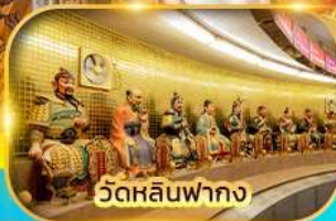
วัดหลินฟากง