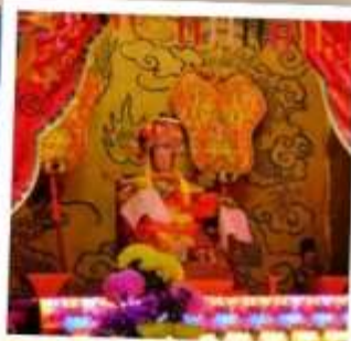
เจ้าแม่ทับทิม จอสเฮาส์เบย์