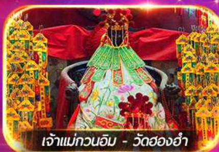
เจ้าแม่ทวนอิม - วัดฮ่องกง