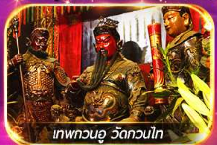
เทพทวนอู วัดกวนไท

พามุไหว้พระขอพร 8 วัดดัง เล่นเครื่องเล่นดิสนีย์แลนด์เต็มวัน ชมพลุสุดอลังการ