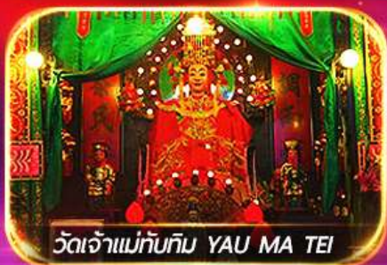
วัดเจ้าแม่ทับทิม YAU MA TEI