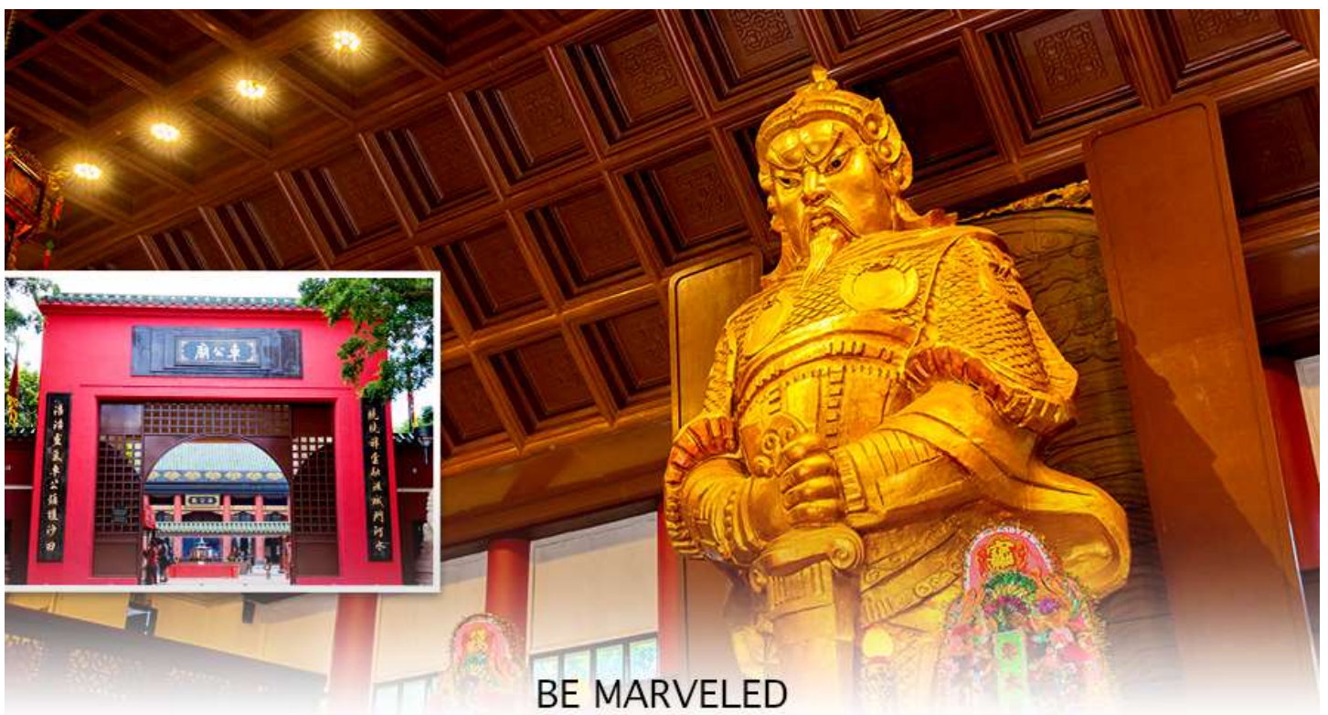
BE MARVELED วัดแชกง

นำท่านเดินทางสู่ วัดแชกงหมิว หรืออีกชื่อหนึ่งว่า “วัดกังหันลม” โดยมีสัญลักษณ์เป็นกังหันนำโชค สร้างขึ้น เพื่อรำลึกถึงท่านแชกงองค์เก่าแก่ มีอายุกว่า 300 ปี ตั้งอยู่ในเขต SHATIN ให้ท่านได้จุดธูปขอพร ลักการะ เทพเจ้า แชกง เป็นอีกหนึ่งวัดที่มีประวัติศาสตร์อันยาวนาน มีตามตำนานเล่ากันว่าได้มีโจรสลัดต้องการที่จะมาปล้นชาวบ้าน เมื่อนายพลแชกงรู้เข้าก็ได้บอกให้ชาวบ้านปักกังหันลมแล้วนำไปติดไว้ที่หน้าบ้าน ปรากฏว่าโจรสลัดได้จากไปและไม่ได้ ทำการปล้น ชาวบ้านจึงมีความเชื่อว่ากังหันลมนั้นช่วยขจัดสิ่งชั่วร้ายที่กำลังจะเข้ามา และนำพาสิ่งดีๆ มาสู่ตน จึงได้ สร้างวัดแชกงแห่งนี้ขึ้น เพื่อระลึกถึงนายพลแชกง และเป็นที่พักการะบูชาเพื่อไม่ให้มีสิ่งไม่ดีเกิดขึ้น โดยจะมีวิธีการไหว้ คือ ตั้งจิตอธิษฐานด้านหน้าองค์เจ้าพ่อแชกง จากนั้นให้ท่านหมุนกังหัน จะมีกังหัน 4 ใบพัด แต่ละใบหมายถึงพร 4 ประการ คือ เดินทางปลอดภัย, สุขภาพแข็งแรง, สมความปรารถนา, และ โชคลาภเงินทอง เชื่อกันว่าหากหมุนครบ 3 รอบและตักลง 3 ครั้ง ถือว่าเป็นการช่วยหมุนปัดเป่าเอาสิ่งร้ายและไม่ดีออกไปให้หมด และนำพาสิ่งดีๆ เข้ามาแทน