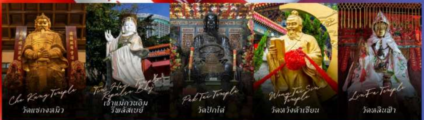
Che Kung Temple วัดเซกทงหนิว

รายการทัวร์ข้างต้นอาจมีการปรับเปลี่ยนเพื่อความเหมาะสม