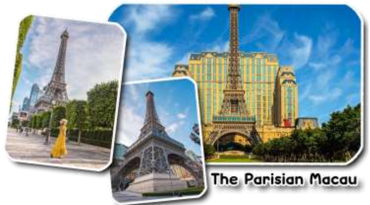
The Parisian Macau

และนำท่านชม The Parisian Macao (เดอะปารีสเซียน มาเก๊า) เป็นอีกหนึ่งแลนด์มาร์คของมาเก๊าที่ได้ยกหอไอเฟลมาจำลองใจกลางเมือง Cotai Strip โรงแรมแห่งนี้ได้รับแรงบันดาลใจมาจากเมืองปารีส ประเทศฝรั่งเศส นครแห่งศิลปะที่มีความงดงามทางด้านสถาปัตยกรรม ความโดดเด่นของหอไอเฟลกลิ่นอายของความคลาสสิกและความโรแมนติกมาไว้ที่โรงแรมแห่งนี้