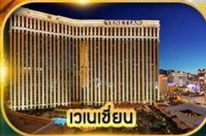
เวเนเซียน