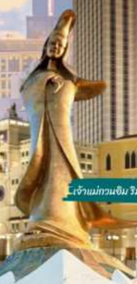
เจ้าแม่กวนอิม ริมทะเล