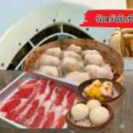
จัดของว่างแถม