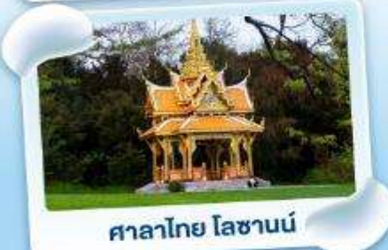
ศาลาไทย ไหลซานน์