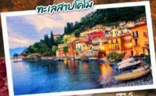
ตามรอยซีรีส์