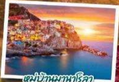
หมู่บ้านมหานทีโลก