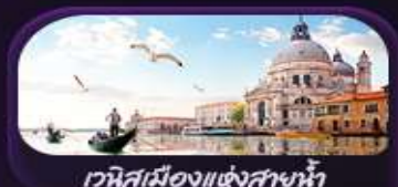
เวนิสเมืองแห่งสายน้ำ

เปิดเส้นทางยุโรปสุดโรแมนติกเหนือเมฆ โรม ไทคอมเซียน น้ำพุเทรวี บันไดสเปน เวนิสเมืองแห่งสายน้ำ โคโม มนต์เสน่ห์แห่งมิลาน ดูโอโป มหาวิหารพลอเรนซ์ ความหรูหราแห่งเซียน่า มหาวิหารเซียน่า จักร์สปีอาซซา เดล แคมโป เที้ยวสวิสตะลุยจุงเฟรา Top Of Europe ชมเมืองดังลูเซิร์น สะพานโบซาเปลา สิงโตแกะสลัก เมืองปารีสเมืองสุดคลาสสิก หอไอเฟล สุฟร์ มหาวิหารนอเทรอดาม ประติมากรรม อลังการพระราชวังแวร์ซาย ช้อปปีงเอาท์ที่ลิตซ์ซันน่า