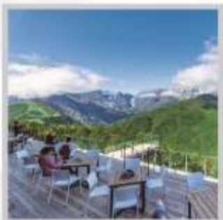
“HAKUBA MOUNTAIN HARBOR”

นำท่านไปไอบกอดธรรมชาติที่ครบครันในที่เดียว “คามิโคจิ” สวิสเซอร์แลนด์แดนญี่ปุ่นเทือกเขาที่ปกคลุมด้วยหิมะสวยงาม ชมความงามของ “ทุ่งพืชมอส ฟุจิชิบะซากุระ” มนต์เสน่ห์..พรมธรรมชาติสีชมพูหลากหลายสีสันสวยสดใส เปลี่ยนอริยาบท “ขึ้นกระเช้าฮาคุบะ อิวะตะเกะ” เพื่อชมวิวพาโนรามาของเทือกเขาแอลป์ญี่ปุ่นกันให้อิ่มใจ สัมผัสกลิ่นอายเมืองเก่า “เมืองทาคายามา” ที่ยังคงอนุรักษ์ความเป็นอยู่ เมื่อสมัยเอโดะกว่า 300 ปี สายช้อปปิ้งห้ามพลาด “คารุอิซาวะ: เอ้าท์เล็ต” แลนด์มาร์กของเมืองคารุอิซาวะ และ “ย่านชินจุกุ” แห่งเมืองโตเกียว ชมความงามกับเส้นทาง “เจแปนแอลป์ (ท่าแพงหิมะ)” สุดยอดของการท่องเที่ยวที่ถูกขนานนามว่า “หลังคาแห่งญี่ปุ่น”