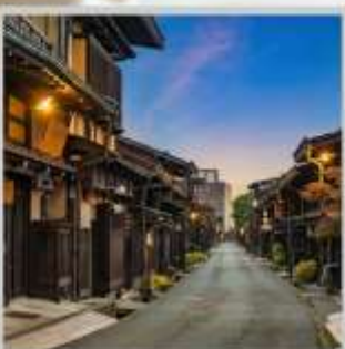
“TAKAYAMA OLD TOWN”