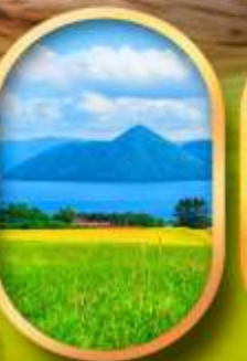
ทะเลสาบโทยะ