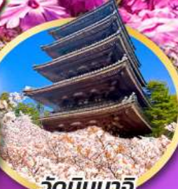
วัดนินนาริ