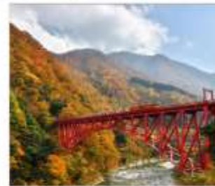
รถไฟชมวิวยุเมเวาคุโรเมะ