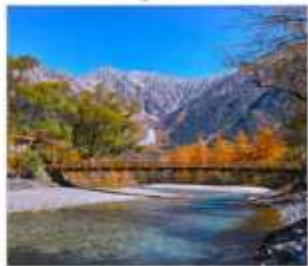
ดามิโดจิ