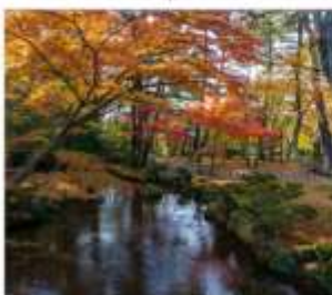
สวนเคนโระคุเซ็น