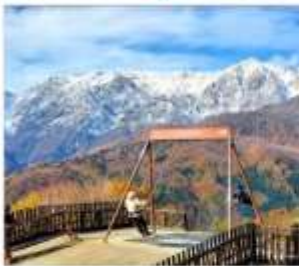
ซาคุนะอิวาทาเกะ