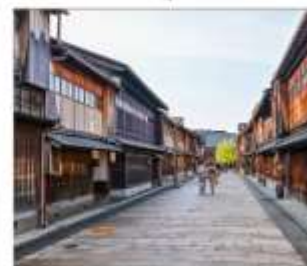
ย่านโรงน้ำชาอิงาชิบายะ