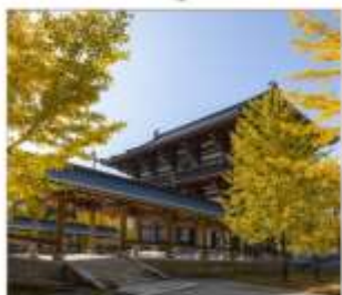
วัดไดชิซังเซอิโดจิ