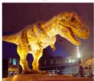
พิพิธภัณฑ์ไดโนเสาร์