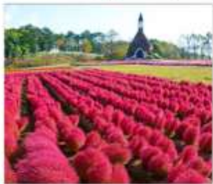
สวนดอกไม้มัมกคะโนะซาโตะ