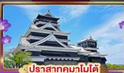
ปราสาทคุมาโมโตะ