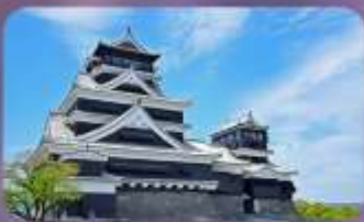
ปราสาทคุมามาโด้