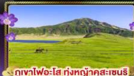
ภูเขาไฟอะโฮะ-โซ ทุ่งหญ้าคุสะเซนิริ