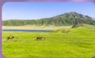
ภูเขาไฟอะโส ทุ่งหญ้าคุสะเซนริ