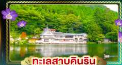
ทะเลสาบคินริน