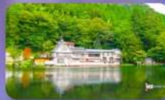
ทะเลสาบคินริน