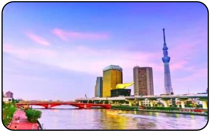
แม่น้ำซูมิตะ

“ขอพรด้านการเงิน” โชคลาภ และความสำเร็จในธุรกิจ ส่วนไฮไลท์สำคัญของวัดนี้คือ ไคคอน หรือหัวไชเท้า สัญลักษณ์ศักดิ์สิทธิ์ คนที่นี้เชื่อว่าไคคอนช่วย “ชำระล้างสิ่งไม่ดี” และนำโชคลาภเข้ามา นักท่องเที่ยวมักนำไคคอนไปถวายเพื่อขอพร