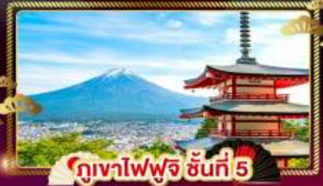
ภูเขาไฟฟูจิ ชั้นที่ 5

ชมลาวเนเดอร์ ที่ สวนโออิชิปาร์ค อิสระ 1 DAY TRIP