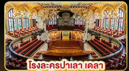
โรงละครปาลาเดลา มุสิกก้า คาคาลานา