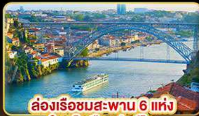
ล่องเรือชมสะพาน 6 แห่ง ในคูโรเมืองปอร์โต