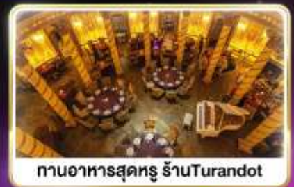
ทานอาหารสุดหรู ร้านTurandot