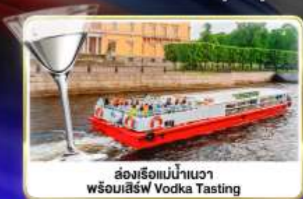
ล่องเรือแม่น้ำแคว พร้อมเสิร์ฟ Vodka Tasting