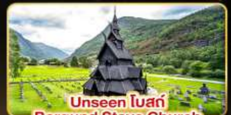
Unseen ไม้สัก Borgund Stave Church