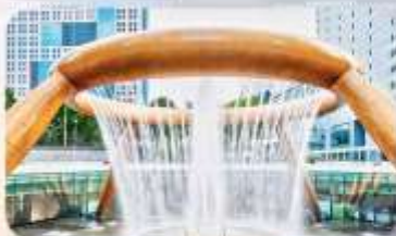
Fountain of Wealth