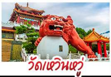
วัดเขวินเซวี่

อาลีซาน - ทะเลสาบสุริยอินจันตรา - ไทเป 101 วัดหวินหู้ - อนุสรณ์สถานเจียง ไคเชก วัดหลงชาน - ตลาดกลางคืนซีเหมินติง เมปู หมอหนึ่งจักรพรรดิ - เขียวหลงเป่า - ชาบูไต้หวัน