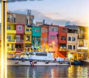
ท่าเรือประมงเจิ้งปิง