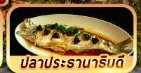
ปลาประรานาภิรมดี