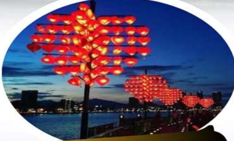
สะพานแห่งความรัก