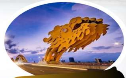
สะพานมังกร (Dragon Bridge)

นำท่านชม สวน APEC มุมถ่ายรูปสุดชิคที่ไม่ควรพลาดในดานัง ตั้งอยู่ริมฝั่งแม่น้ำฮาน ใกล้ๆ สะพานมังกร เมืองดานังนั่นเอง ซึ่งประเทศเวียดนามสร้างไว้เพื่อต้อนรับการประชุม APEC ที่ประเทศเวียดนามในปี 2017 โดยมีจุดเด่นคือเป็นโดมขนาดยักษ์ ที่สร้างมาจากเหล็ก 200 ตัน รูปทรงมีลักษณะเหมือน 'วาวยักษ์' ซึ่งใหญ่จริง และทาสีขาวได้อย่างลงตัว ถ่ายรูปออกมาสวยชิคทุกมุม