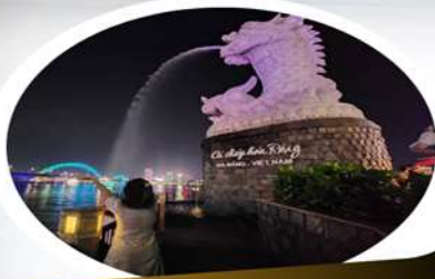
Dragon Carp Statue