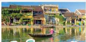
เมืองโบราณเฮงฮัน

! พักบนเขาน้ำฮิลล์ 1 คืน ! สัมผัสอากาศเย็นตลอดปี สโตร์ฝรั่งเศสสุดคลาสสิก - นั่งกระเช้ายาวที่สุด สูบานาฮิลล์ สุกสุดมันส์ไปกับสวนสนุก The Fantasy Park นมัสการเจ้าแม่กวนอิมองค์ใหญ่ที่สุดของเมืองดานัง - เช็กอินเมืองมรดกโลกฮอยอัน - สนุกสนานไปกับกิจกรรม!!นั่งเรือกระดิง หมู่บ้านกัมทาน เช็กอินร้านกาแฟ SON TRA MARINA CAFE - ไม้ลงร้านช้อปปิ้ง - อิ่มอร่อยกับบุฟเฟ่ต์นานาชาติ , หม้อไฟซีฟู้ด