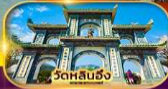
วัดหลันฮั่ง