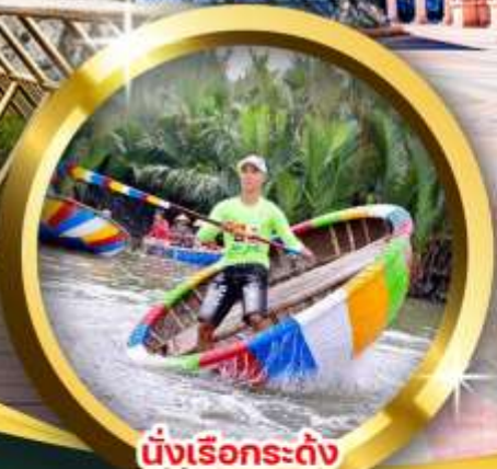
นั่งเรือกระดิ่ง