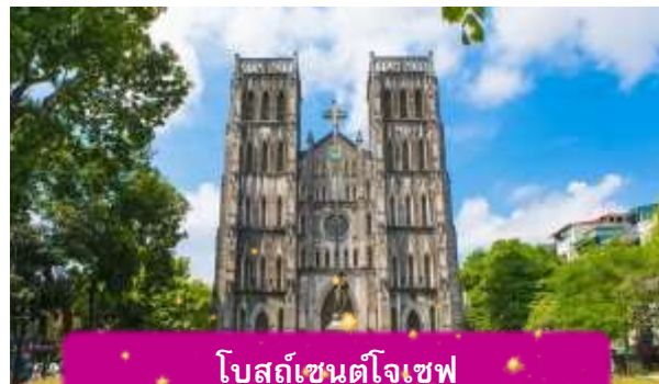
โบสถ์เซนต์โจเซฟ