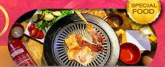
พิเศษเมนู BBQ Buffet เดินทาง มี.ค. - ต.ค. 69