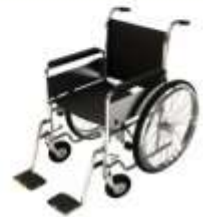
การรับการดูแลเป็นพิเศษ

กรณีผู้เดินทางต้องการความช่วยเหลือเป็นพิเศษ อาทิเช่น การใช้วีลแชร์ กรุณาแจ้งบริษัทฯ อย่างน้อย 7 วันก่อนการเดินทาง มิฉะนั้นบริษัทฯ จะไม่สามารถจัดการล่วงหน้าได้ เนื่องจากการขอวีลแชร์ในสนาม บินนั้น ต้องมีขั้นตอนในการขอล่วงหน้า และบางสายการบินอาจมีการเรียกเก็บค่าใช้จ่ายทั้งทางสนามบิน ในไทยและในต่างประเทศ ซึ่งผู้เดินทางสามารถสอบถามกับเจ้าหน้าที่ได้โดยตรงก่อนทำการจอง และหาก ในขณะของท่านมีผู้ต้องการดูแลพิเศษ เช่น ผู้ที่นั่งรถเข็น (Wheelchair), เด็ก, ผู้สูงอายุและผู้ที่มีโรค ประจำตัวหรือไม่สะดวกในการเดินทางท่องเที่ยวในระยะเวลาเกินกว่า 4 - 5 ชั่วโมงติดต่อกัน ท่านและ ครอบครัวต้องให้การดูแลสมาชิกภายในครอบครัวของตนเอง เนื่องจากการเดินทางเป็นหมู่คณะ หัวหน้า ทัวร์มีความจำเป็นต้องดูแลคณะทัวร์ทั้งหมด