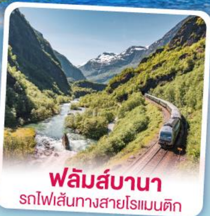
พหลิมส์บานา รถไฟเส้นทางสายโรแมนติก