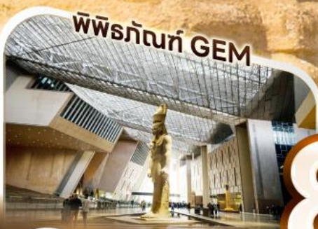
พิพิธภัณฑ์ GEM