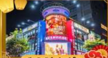
ช้อปปิ้งในไถเป่า