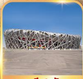
สนามกีฬาแห่งชาติ