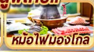
หม้อไฟมองโกล