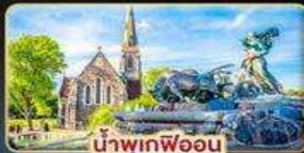
น้ำพุเคฟลอน