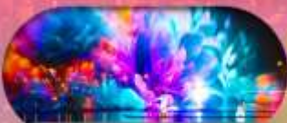
หมู่บ้านเนียนฮัววาน ชมแสงสียามค่ำคืน

เชียงใหม่ หางโจว ล่องเรือทะเลสาบซีหู อุ๊ซี