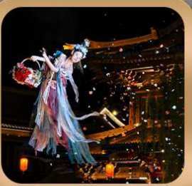
“เมืองโบราณลั่วอี้”