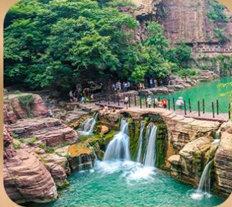
“อุทยานหยุนไท่ซาน”

ชมถ้ำหลงเหมิน มรดกโลกที่เมืองลั่วหยาง • สุสานจีนซีฮ่องเต้ • ศาลเจ้ากวนอู วัดเส้าหลิน + ป่าเจดีย์ + ชมโชว์กังฟู • เมืองโบราณลั่วอี้ • อุทยานหยุนไท่ซาน เจดีย์ห้าพันปี • ถนนวัฒนธรรมต้าถัง • ถนนคนเดินอิสลาม • จัตุรัสหอระฆัง