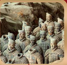
“สุสานจีนซีฮ่องเต้”