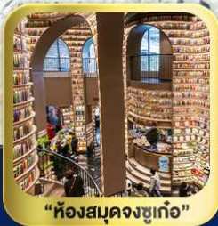
“ห้องสมุดจงชู่เก๋อ”