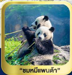
“ชมหมีแพนด้า”