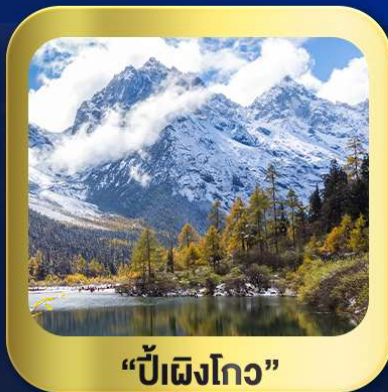
“ปี้เฉิงโกว”