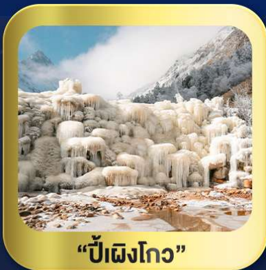
“ปี้เฉิงโกว”

นั่งกระเช้าชมวิว ภูเขาหิมะ-ต้ากู่กลาเซียร์ • ชมความสวยงาม ณ อุทยานปี้เฉิงโกว ห้องสมุดจงชู่เก๋อ • ศูนย์หมีแพนด้า • ตงเจียวจี้ • ซอยกว้างชวยเคบ