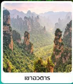
เขาหวอดตาร