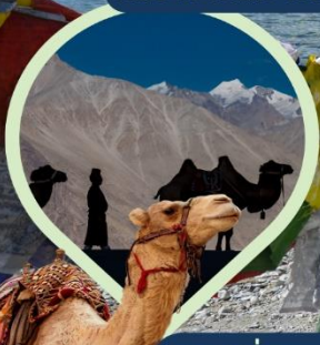
ซิลลี่ ซ็อฐู ทะเลทราย กลางอ้อมกอดหิมาลัย