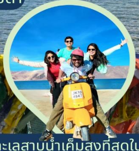
ทะเลสาบน้ำเค็มสูงที่สุดในโลก แปงกอง