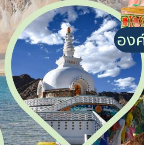
เจดีย์สันติภาพ