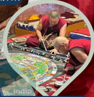
พระลามะ ผู้มีวัตรปฏิบัติ อันอัศจรรย์