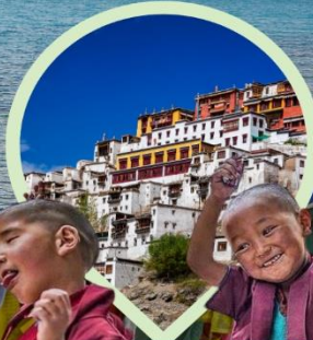
วัดริเบตนิคายมหายาน หมวกแดง หมวกเหลือง