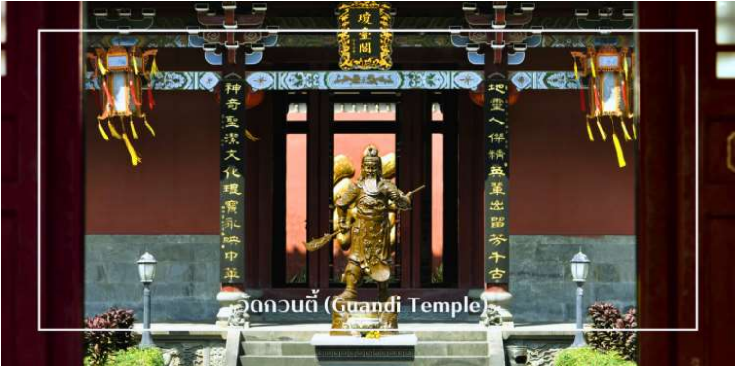
วัดกวนตี้ (Guandi Temple)

นำท่านชม วัดกวนตี้ (Guandi Temple) ศาสนสถานสำคัญที่สร้างขึ้นเพื่ออุทิศแด่ กวนอู วีรบุรุษผู้เลื่องชื่อแห่งยุคสามก๊ก ซึ่งได้รับการยกย่องในฐานะสัญลักษณ์ของความซื่อสัตย์ ความกล้าหาญ และคุณธรรม วัดแห่งนี้มีความสำคัญทั้งในเชิงประวัติศาสตร์ วัฒนธรรม และความศรัทธาของชาวจีน ภายในประดิษฐานองค์กวนอูอันศักดิ์สิทธิ์ ซึ่งชาวจีนนิยมเดินทางมาสักการะเพื่อขอพรด้านความเจริญก้าวหน้า การค้า และความเป็นสิริมงคล