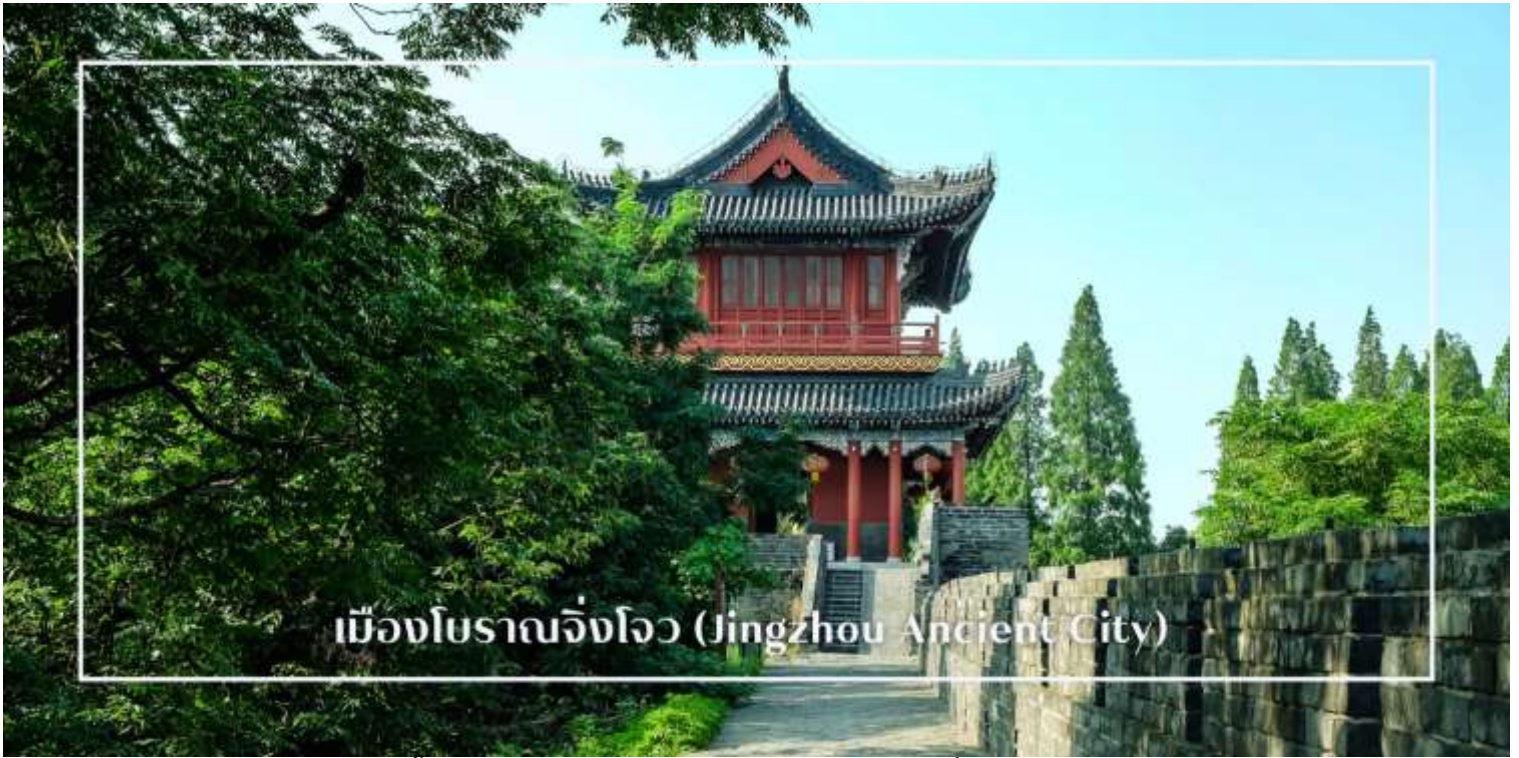
เมืองโบราณจิ่งโจว (Jingzhou Ancient City)

นำท่านชม วัดกวนตี้ (Guandi Temple) ศาสนสถานสำคัญที่สร้างขึ้นเพื่ออุทิศแด่ กวนอู วีรบุรุษผู้เลื่องชื่อแห่งยุคสามก๊ก ซึ่งได้รับการยกย่องในฐานะสัญลักษณ์ของความซื่อสัตย์ ความกล้าหาญ และคุณธรรม วัดแห่งนี้มีความสำคัญทั้งในเชิงประวัติศาสตร์ วัฒนธรรม และความศรัทธาของชาวจีน ภายในประดิษฐานองค์กวนอูอันศักดิ์สิทธิ์ ซึ่งชาวจีนนิยมเดินทางมาสักการะเพื่อขอพรด้านความเจริญก้าวหน้า การค้า และความเป็นสิริมงคล