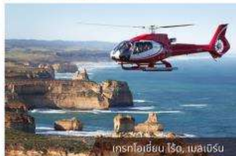
เฮลิคอปเตอร์บิน ไรต์, เมลเบิร์น