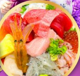
ตลาดปลาฮิมิสู คาชิโนะจิ

ถ่ายรูปเช็คอินวิวฟูจิ กับซุ้มประตูโทเซคิจิ แซนมอน อิสระท่องเที่ยว ช้อปปิ้งหนึ่งวันเต็มในโตเกียว