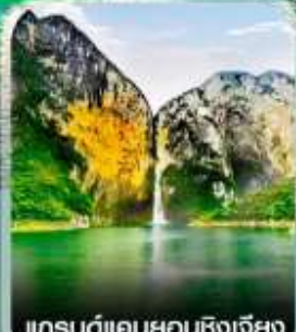
แกรนด์แคนยอนชิงเจียง