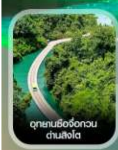
อุทยานชิงจื่อทวน ด่านสิงโต

สัมผัสมหัศจรรย์ ถ้ำหลงหลินกง ธารน้ำสีมรกตใสราวกระจก แกรนด์แคนยอนผิงซาน ล่องเรือชมธรรมชาติ แกรนด์แคนยอนชิงเจียง