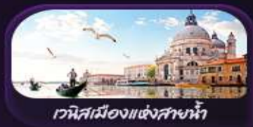
เวนิสเมืองแห่งสายน้ำ

เปิดเส้นทางยุโรปสุดโรแมนติกหอเอนปิซ่า ไรม โคโลสเซียน น้ำพุเทรวิ ชันโดสเปน เวนิสเมืองแห่งสายน้ำ โคโม มนต์เสน่ห์แห่งมิลาน ดูโอโป มหาวิหารพลอเรนซ์ ความหรูหราแห่งเซียน่า มหาวิหารเซียน่า จักร์สปีอาซซา เดล แคมโป เที้ยวสวิสตะลุยจุงเฟรา Top Of Europe ชมเมืองดังลูเซิร์น สะพานโบซาเปลา สิงโตแกะสลัก เมืองปารีสเมืองสุดคลาสสิก หอไอเฟล สุฟร์ มหาวิหารนอเทรอดาม ประติมากรรม อลังการพระราชวังแวร์ซาย ช้อปปีงเอาท์ที่เลิศชั้นนำ