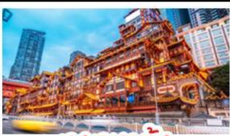
เจียงหยาดัง

อุทยานหุบหม่นบ่อฟ้า - อุทยานเขานางฟ้า หงหยาดัง - นั่งรถไฟทะเลสาบ - อุทยานสี่ดรุณี ปี้ผิงโกว - สะพานหนานเฉียว