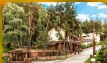
Oi-Qaragai Mountain Resort