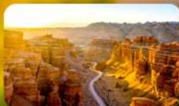
Charyn Canyon+Black Canyon