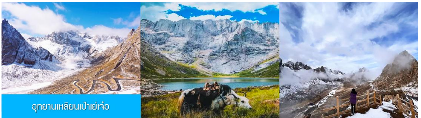
อุทยานเขลิยนเป่าเย่เจ้อ

พักที่ โรงแรม ZUNGE ZHUOYUE HOTEL ระดับ 4 ดาวท้องถิ่นหรือเทียบเท่าในอำเภออาป่า