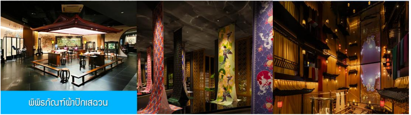
พิพิธภัณฑ์ผ้าปักสวน