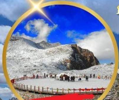
OPTIONAL TOUR ธารน้ำแข็งต่ากู่ปิงชวน